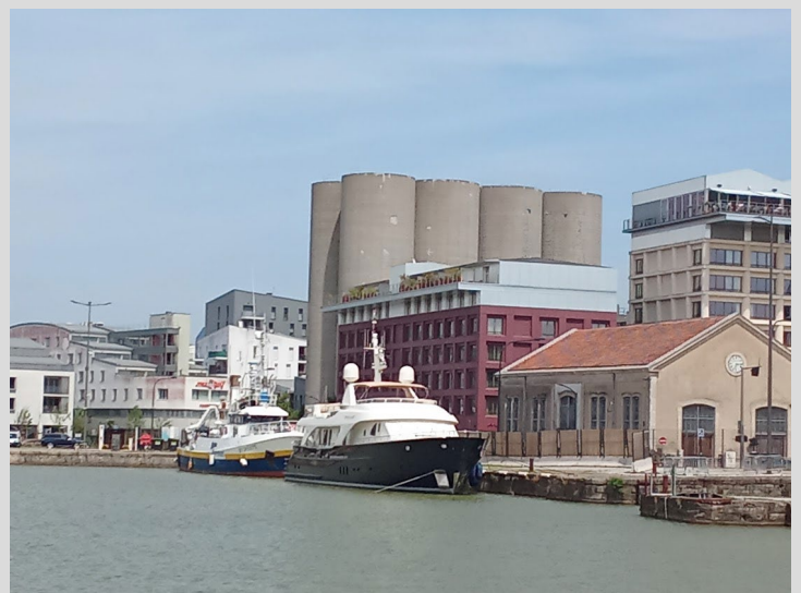
Le bassin N°1, 10 hectares de superficie, recueille les eaux de la Jalle de Blanquefort, un affluent de la rive gauche de la Garonne

La création du premier bassin et l'accueil des bateaux transatlantiques et les infrastructures naissantes ont développé l'industrie bordelaise et son commerce à partir de l'année 1880.