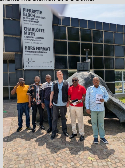
Viste de l'Exposition au Musé d'Art moderne, le 13 juin

Les échanges entre la haute délégation congolaise avec l'autorité municipale et l'Esadse ont posé les bases d'une éventuelle coopération entre les institutions congolaises et la Ville de Saint-Etienne :