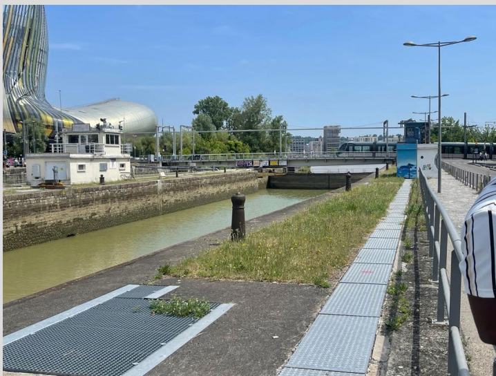
Ecluse à sas inauguré en 1897 permettant le passage des bateaux du bassin N°1 à la Garonne.

Aujourd'hui, près de 160 ha de friches industrielles et portuaires constituent un quartier mixte en pleine mutation architecturale avec d'ambitieux projets résidentiels, culturels et d'agrément, tout en conservant son patrimoine maritime.