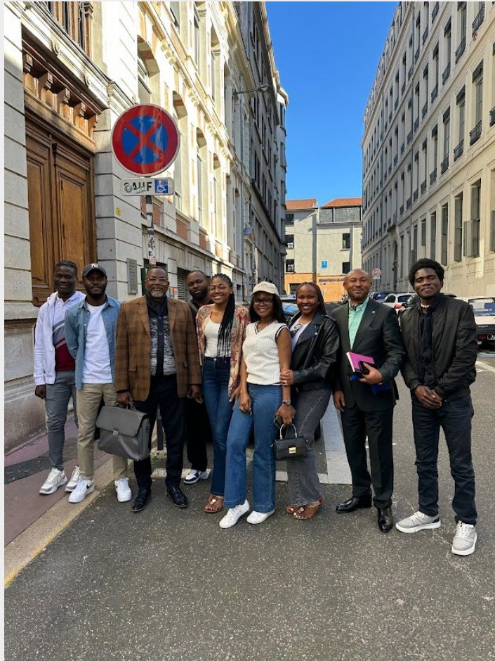
Séance de formation de réflexion et d'orientation avec les jeunes au siège, le 17 mai 2025