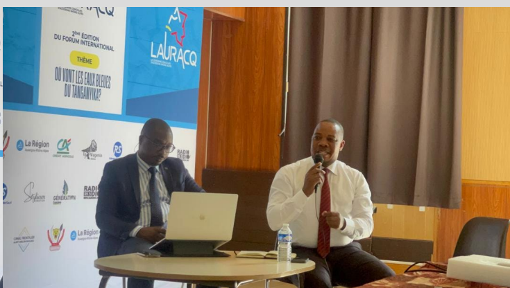
le 14 juin 2025