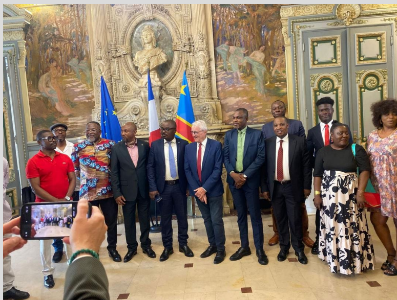
Accueil de la délégation à la Mairie de Saint-Etienne, le 13 juin 2025