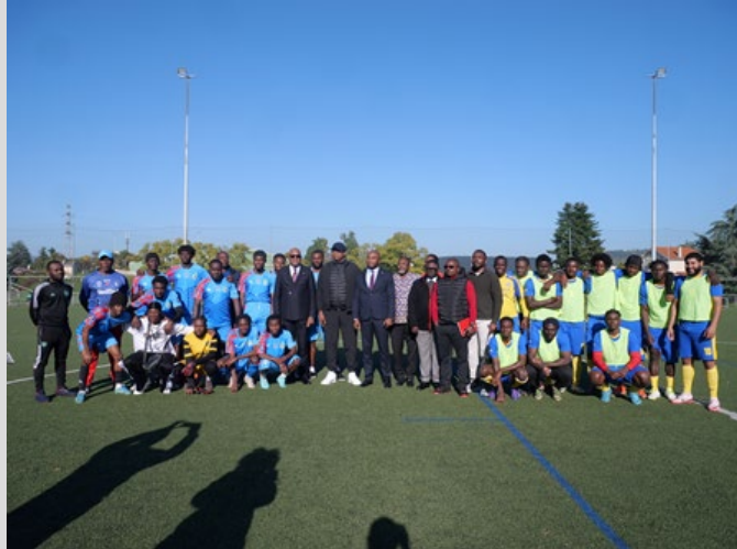
Rencontre RDC – Saint-Etienne, le 18 oct. 2025