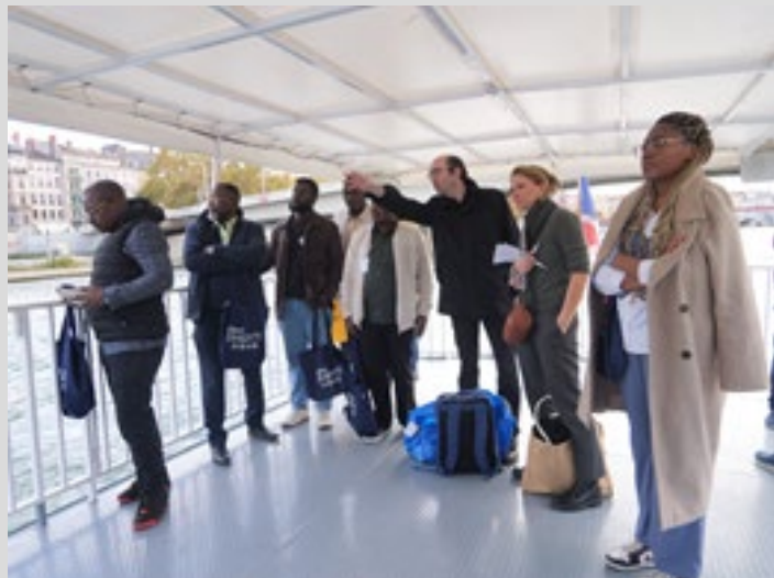
Viste des aménagements portuaires sur la Soane à Lyon, mercredi 22 oct. 2025 par le DG de la RVF et du Conseiller de Chef de l'Etat congolais