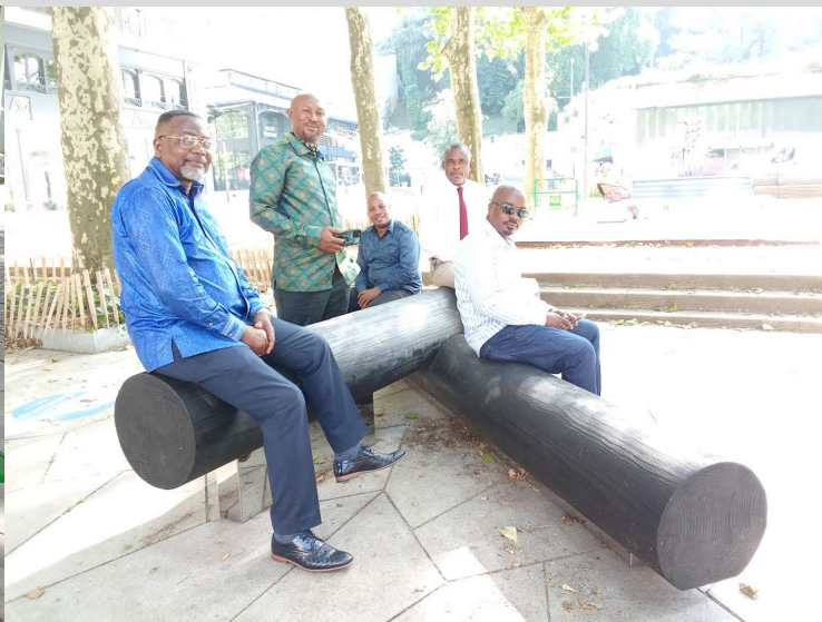
Le 12 juin 2025, place Waldeck-Rousseau -Bancs d'essai fabriqués par les étudiants de l'Esadse en collaboration avec quelques entreprises.