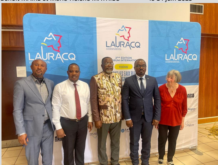
Photo de famille après la conférence, le 14 juin 2025